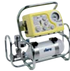
Code G00208000 Ventilator support with housing for one lt. O 2 cylinder